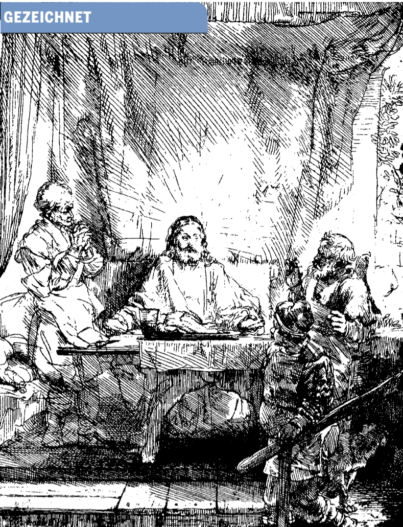
Emmaus Aus dem Buch «Rembrandts Handzeichnungen und Radierungen zur Bibel» (1963), Zwingli-Verlag