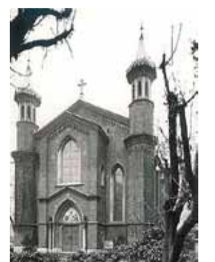
Die Kirche in Mailand wurde 1964 in lombardischer Gotik gebaut.