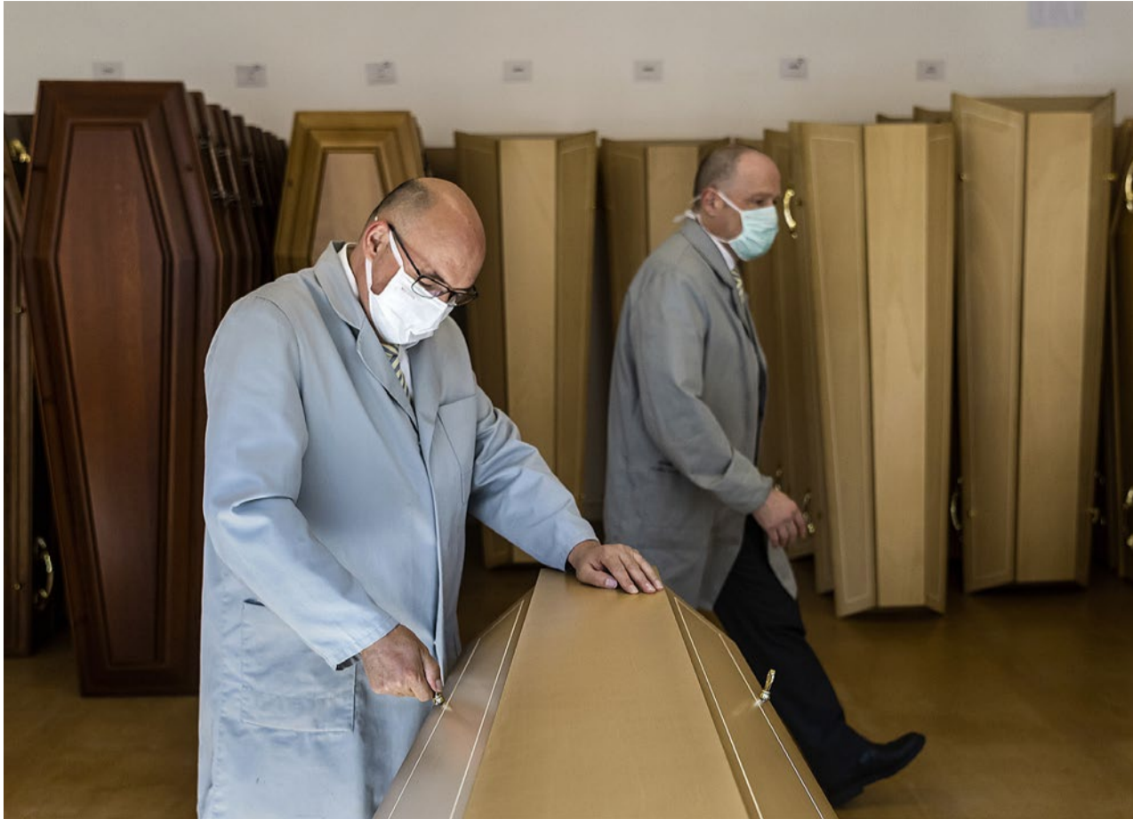
Es sollten alle teilnehmen können, die wollen, meint ein Bestatter zu Trauerfeiern.