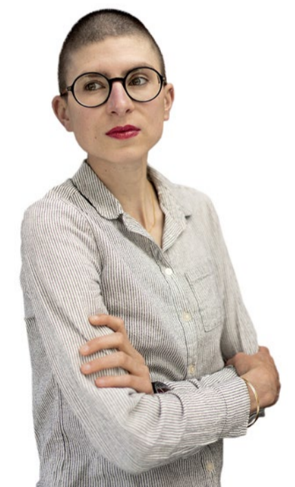
Für «das alles hier, jetzt.» erhielt Anna Stern 2020 den Schweizer Buchpreis.

Vitaparcours in ihrer Nähe: www.zurichvitaparcours.ch/de