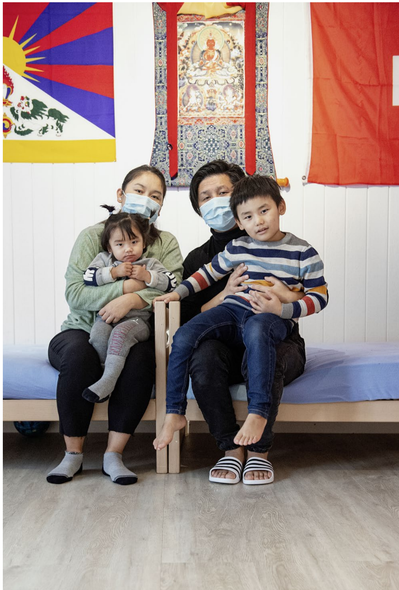
Die Familie aus dem Tibet lebt seit acht Jahren unter prekären Verhältnissen in der Schweiz.

Eine schwierige Situation. Deswegen ist sich auch das zuständige Amt für Bevölkerungsdienste des Kantons Bern (Abev) bewusst. «Dass die in den kantonalen Rückkehrzentren untergebrachten Personen aufgrund unsicherer Zukunftsperspektiven grossen psychischen Belastungen