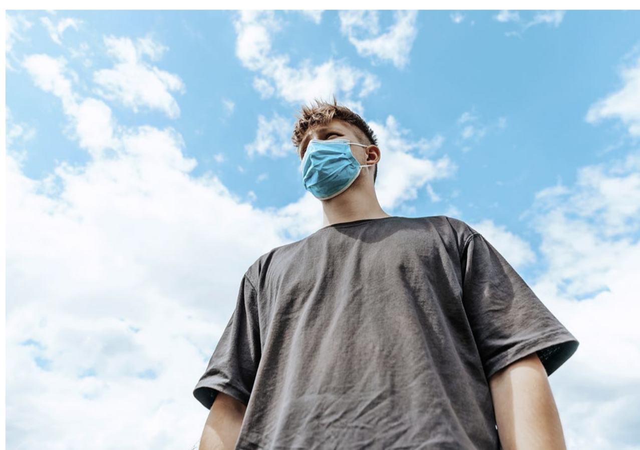
Schwieriger Start: Berufseinsteiger können sich kaum mehr beweisen.

Dass die Nachfrage vor allem dort so stark gestiegen ist, erklärt sich Mennen unter anderem mit dem Jobabbau in der Luftfahrt. Seit