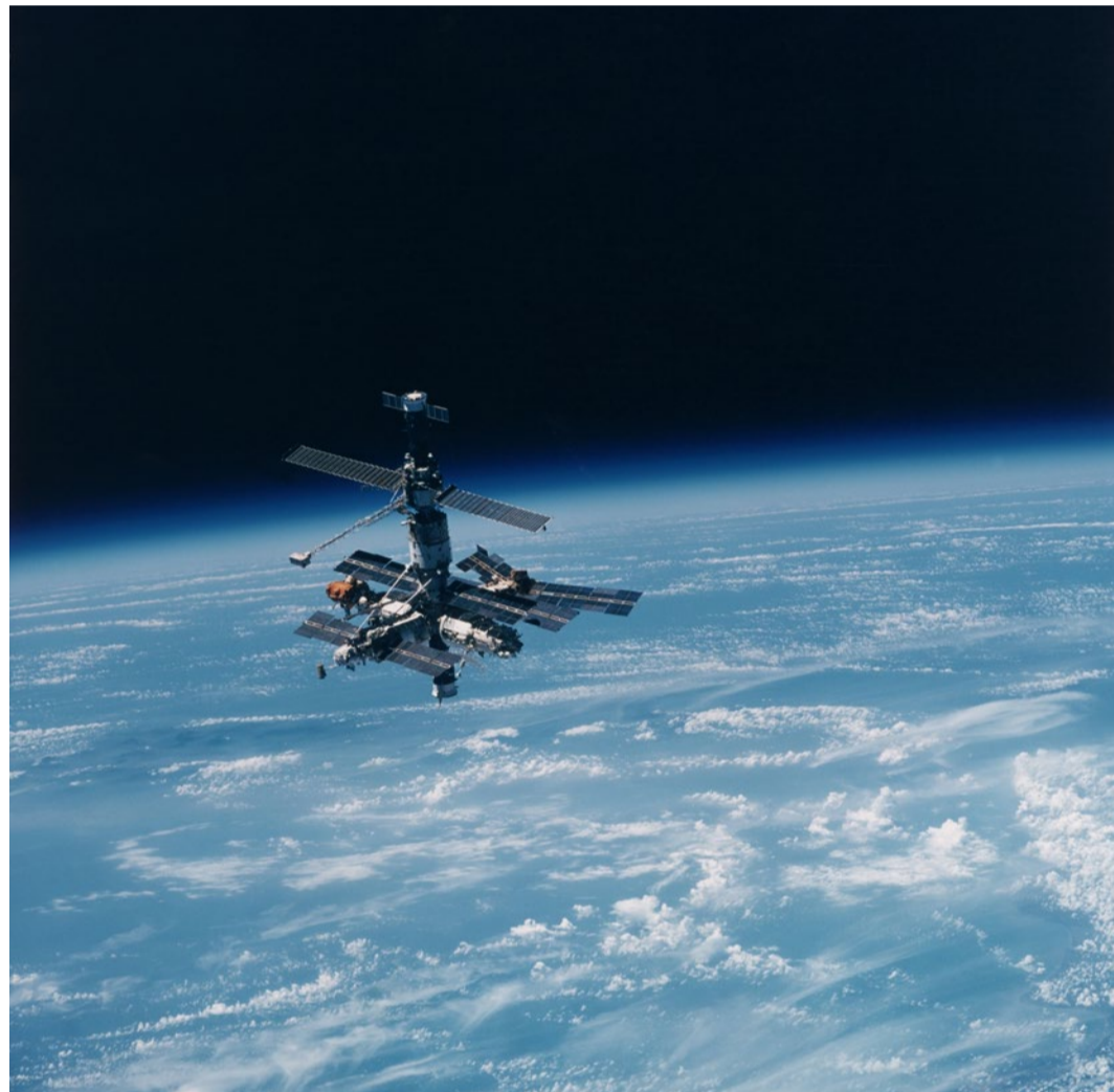
Schwebte von 1986 bis zum kontrollierten Absturz 2001 im All: Die russische Raumfahrtstation Mir.

Ja, dieses Anliegen haben alle Astronauten gemeinsam. Die 90-minütige Umrundung zeigt, die Erde ist zwar gross und die Atmosphäre voluminös, aber nicht unbegrenzt. Auch weiträumige Zusammenhänge sind sichtbar. Meeresströmungen, die man eine halbe Stunde lang beim Überfliegen des Pazifiks beobachten kann. Oder Sahara-Sand, der quer über den Atlantik nach Amerika geweht wird. Man sieht, wie sich die unterschiedlichen Wettergeschehen gegenseitig beeinflussen, dass das, was auf der einen Seite der