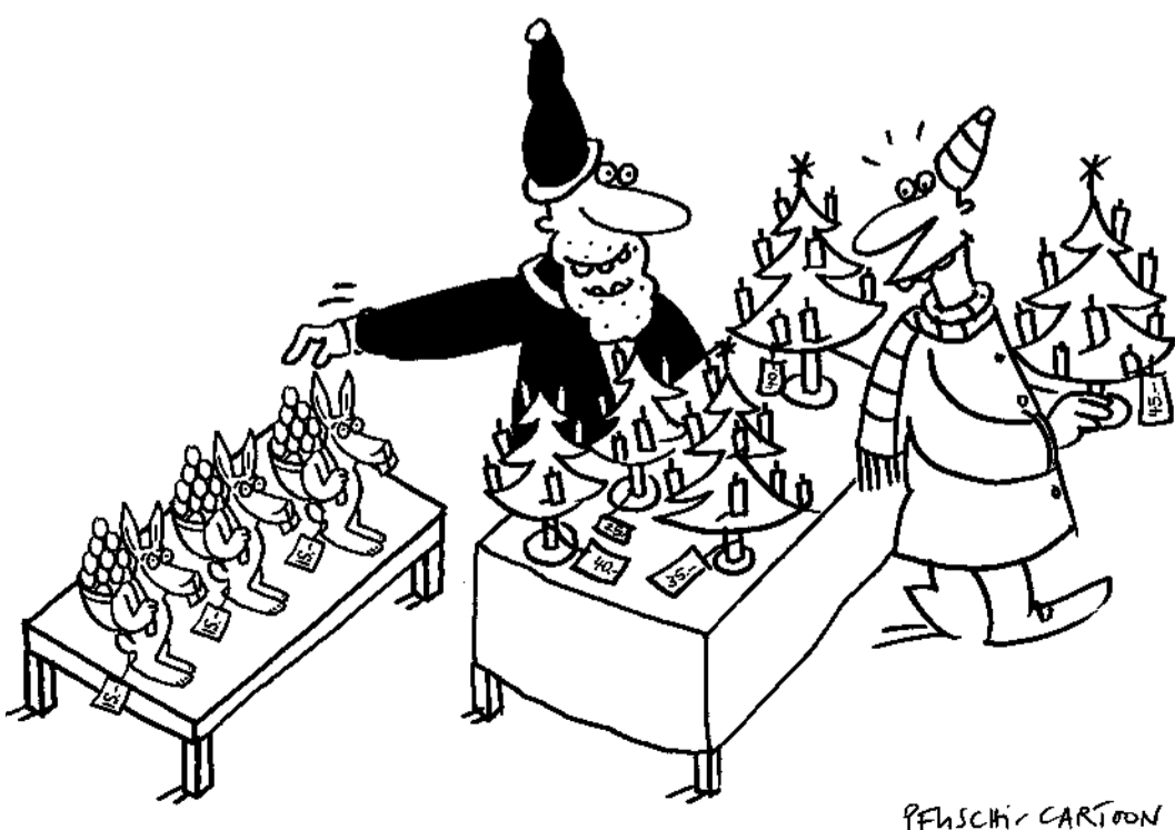
P. FISCHER / CARTOON