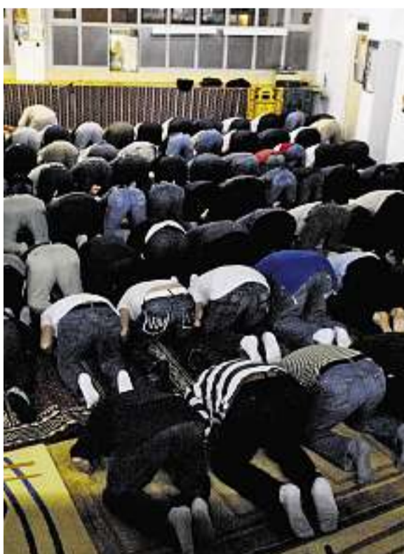
«Haus der Religionen»: Die Umma tritt aus, Muslime sind trotzdem dabei. Szene von der diesjährigen Ramadan-Feier

Der Vorschlag des Synodalrats, ausschliesslich Pfarrpersonen zu ordinieren, entspricht sowohl der Empfehlung des Schweizerischen Evangelischen Kirchenbunds (SEK) als auch der Regelung der Zürcher Kantonalkirche. In der Westschweiz sowie in den Kantonen Schaffhausen, Graubünden und Aargau werden auch sozialdiakonische Mitarbeiterinnen und Mitarbeiter (SDM) ordiniert. RJ