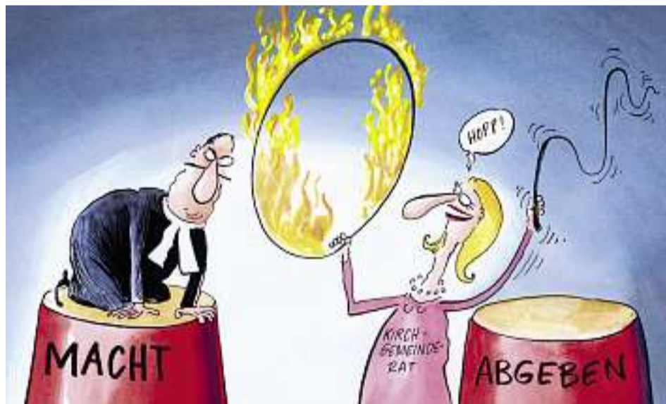
Wer hat das Sagen in der Kirchgemeinde, Pfarrer oder Kirchgemeinderat?

KOMPLIZIERT. Vom Staat entlohnt, von der Kirchgemeinde angestellt, dem Gemeindegesetz organisatorisch und der Kirchenordnung in Fragen der Berufsausübung unterstellt, dem Wort Gottes verpflichtet: Bernische Pfarrer und Pfarrfrauen haben wirklich einen besonderen Status. Kommt dazu, dass Pfarrpersonen vielerorts auch gewissermassen Teil ihrer Anstellungsbehörde sind: Im Kirchgemeinderat, dem «Verwaltungsrat» der Kirchgemeinde, haben sie