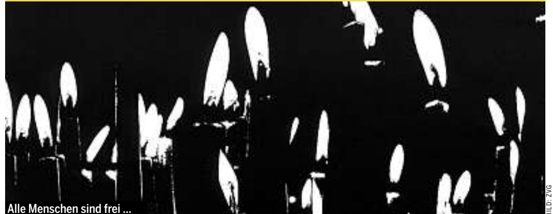
Alle Menschen sind frei ...