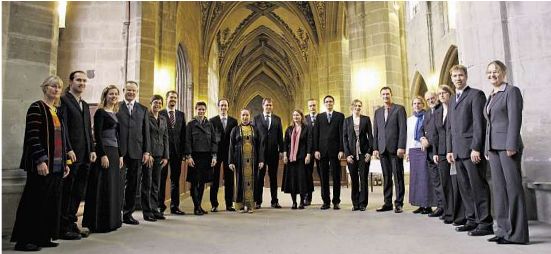
Die Ordination (im Bild die Feier vom 16. November im Münster) soll in der Berner Kirche weiterhin den Pfarrerinnen und Pfarrern vorbehalten bleiben, findet der Synodalrat