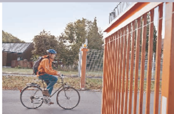
Eintauchen: Witzwil ist ein Kosmos für sich