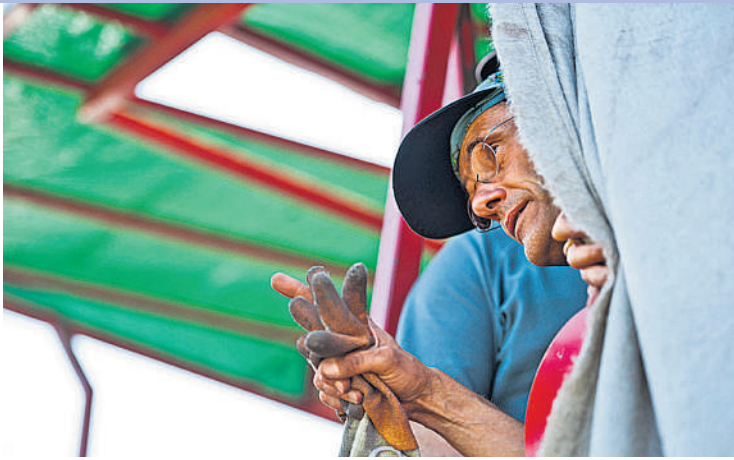
Teilhaben: Staub schlucken auf dem Kartoffelacker