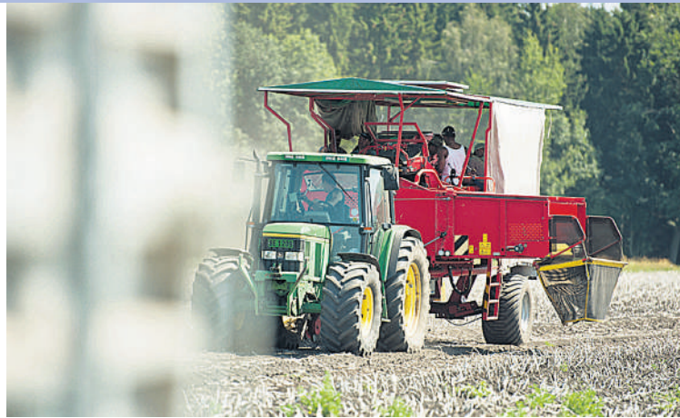
Arbeiten: Schwitzen statt Schwatzen