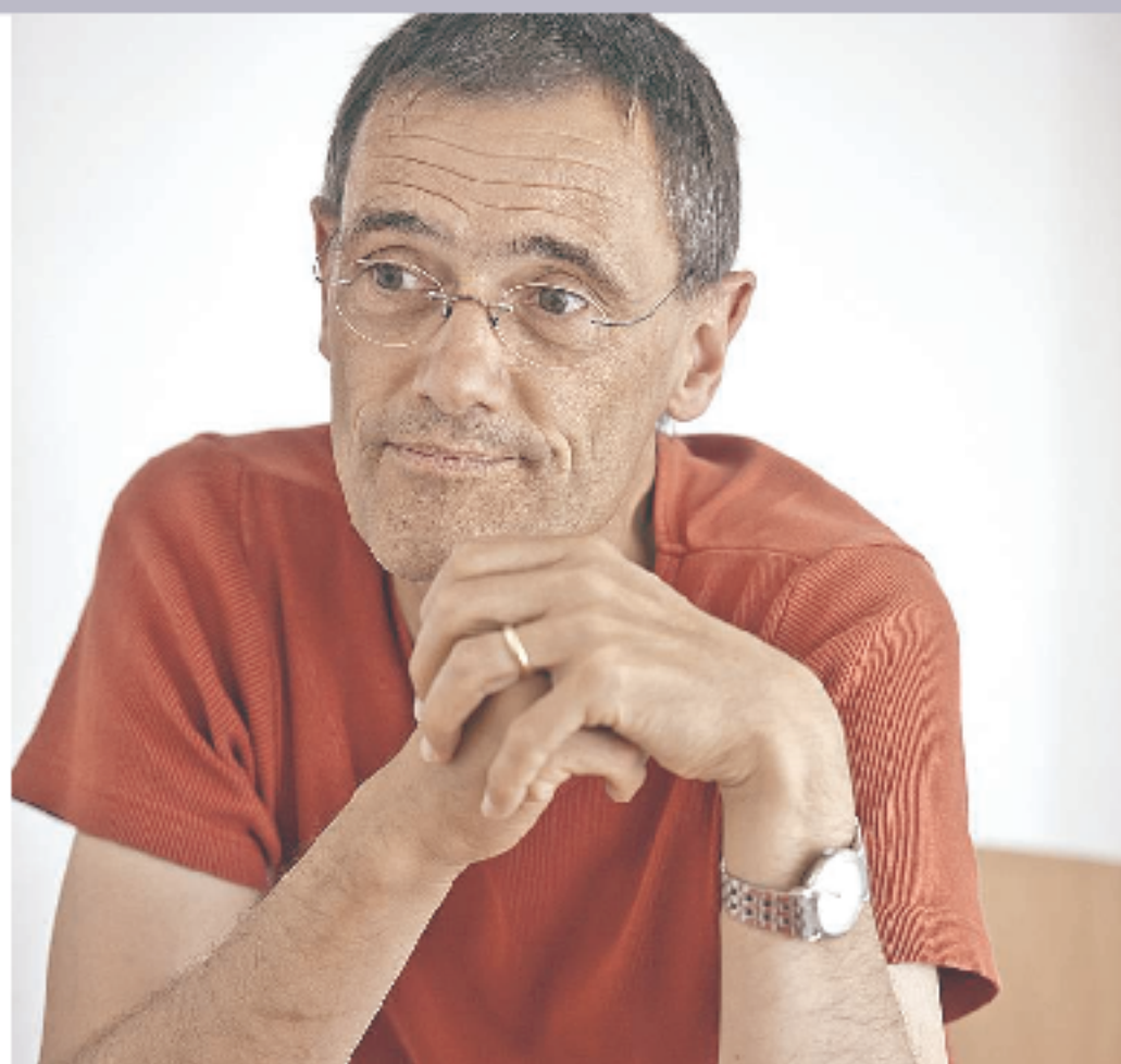
Zuhören: Das A und O jedes Seelsorgegesprächs