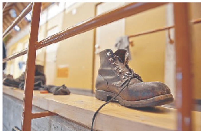
Unterschiede: Im Gefängnis treffen Welten aufeinander