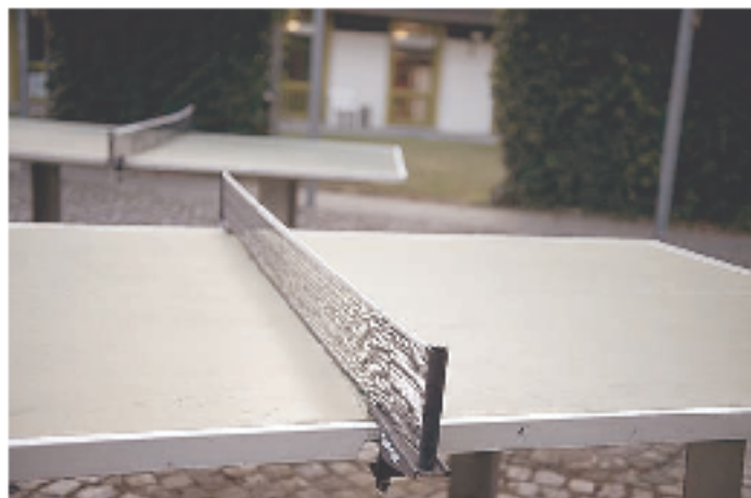
Zeitvertreib: Lange Stunden zwischen Schlafen, Essen und Arbeiten