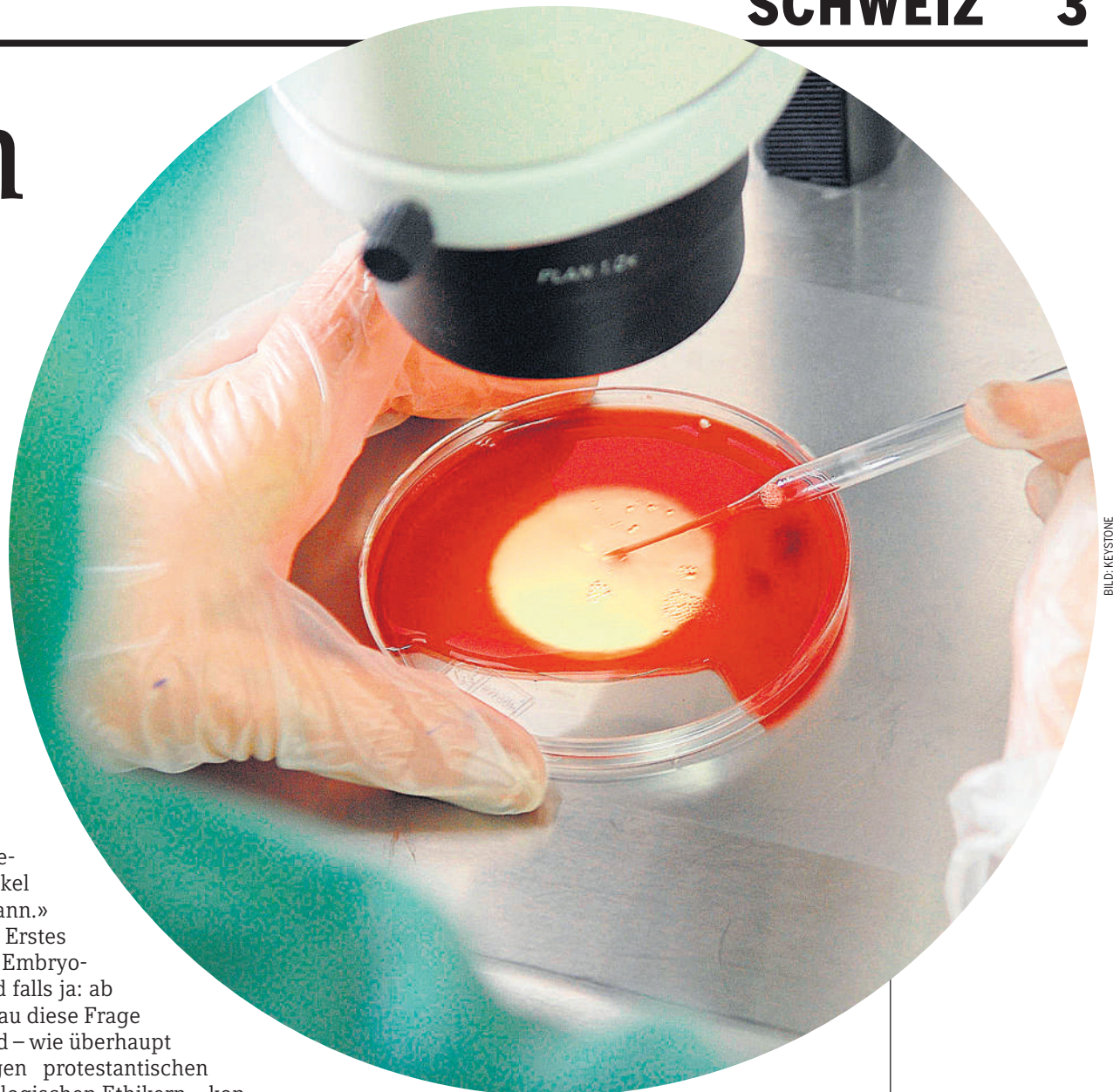
Ein Forscher befruchtet im Labor eine Eizelle

MENSCHENWÜRDE. Auf der anderen Seite gibt es im Protestantismus auch Stimmen, die jene Bedenken vertreten, die der SEK in einer ersten Stellungnahme 2009 formuliert hatte und welche auch die katholische Schweizerische Bischofskonferenz (SBK) äussert: «Das Verfahren der PID, welches das Eliminieren von «kranken» Embryonen zum Ziel hat, ist nicht mit der in der Bundesverfassung verankerten Würde