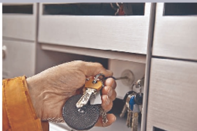
Zusperren: Auch in einer offenen Strafanstalt geht nichts über Sicherheit