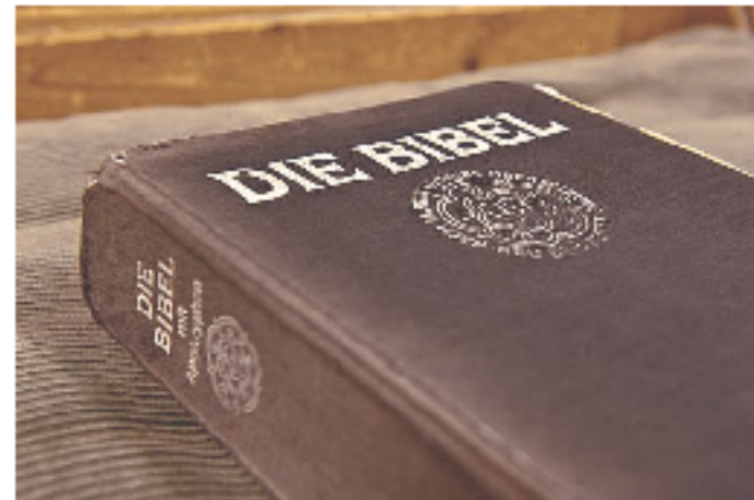
Grundlage: Die Bibel ruft zum Gefangenenbesuch auf