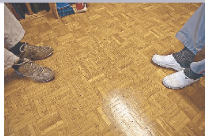
Konfrontieren: Gefängnisseelsorge ist auch Deliktarbeit