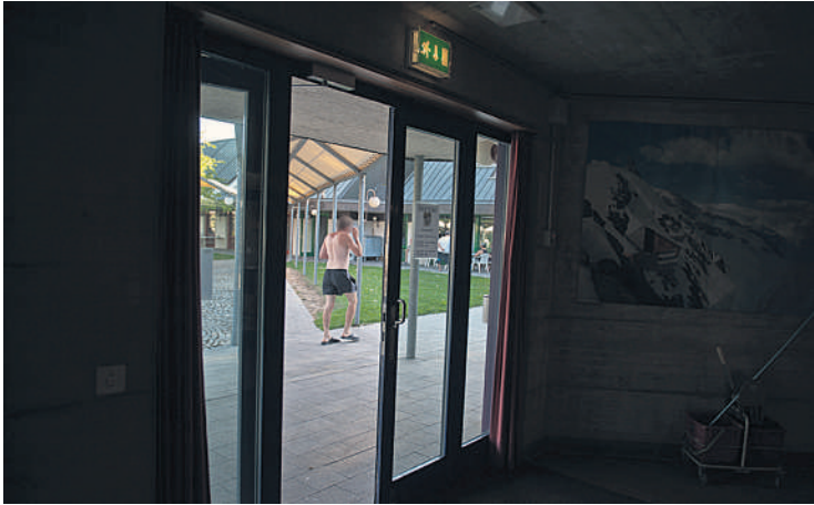
Freiraum: Auslauf im Gefängnishof