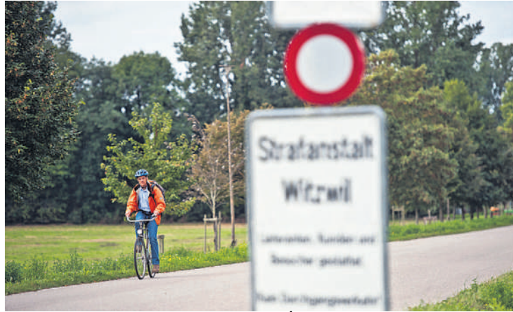
Rückfahrt: Witzwil als Arbeitsort auf Zeit