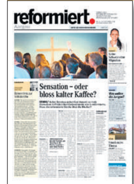
REFORMIERT. 10/11: Dossier «Jugend und Politik»